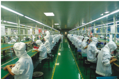
整洁、繁忙、有序的生产车间