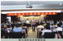
图为消防知识竞赛现场