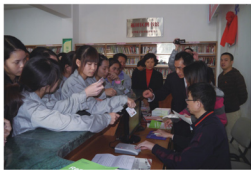
图为员工踊跃申办借书登记手续。

典范城市”称号,一个只有30年历史,却用14年时间坚持办读书节的城市,足以证明深圳市民日常生活的必修课。我们的员工大都是80后90后,正是读书、学习、提升的好时期。通过阅读提高自身素养,通过阅读提升生存能力,通过阅读改变命